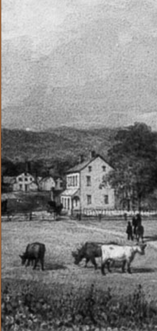
Couverture basée sur The Canada Glass Works at Hudson, aquarelle par James Duncan (circa 1867). Collection privée.